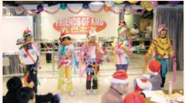
各組展示他們的「聖誕樹」。