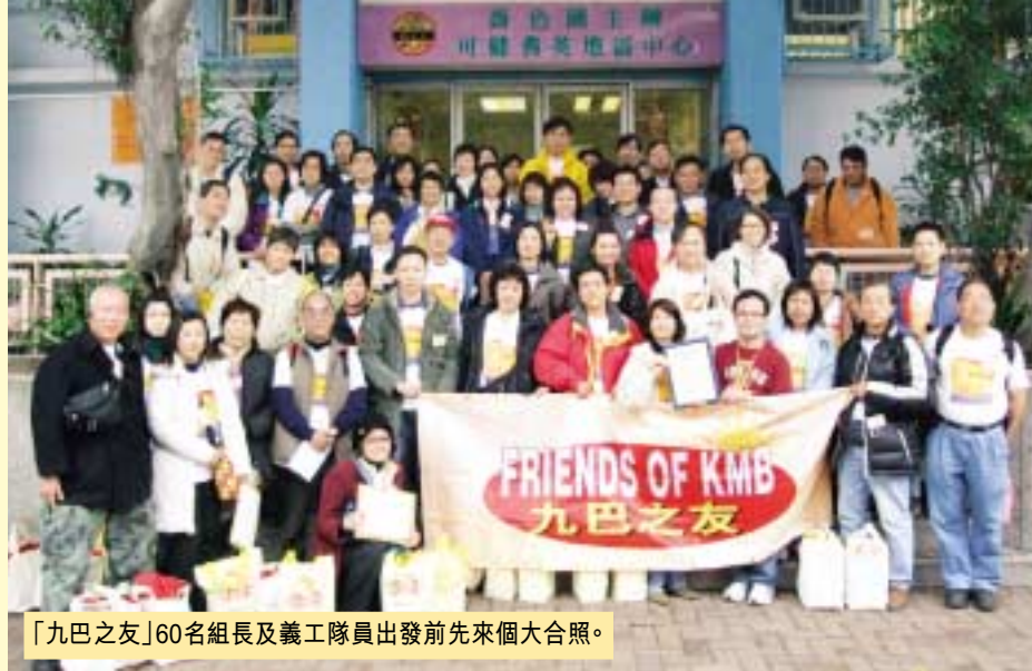
「九巴之友」60名組長及義工隊員出發前先來個大合照。

今個冬季特別悠長而嚴寒。在寒冬之中，除了吃得溫飽、穿得溫暖外，長者尤其需要社會人士的關懷和愛護。「九巴之友」在這個寒冬，與耆色園可健耆英地區中心及義務工作發展局合作，探訪居住於深水埗南昌邨及富昌邨的長者，並送贈禮物包，為長者帶來一點溫暖。