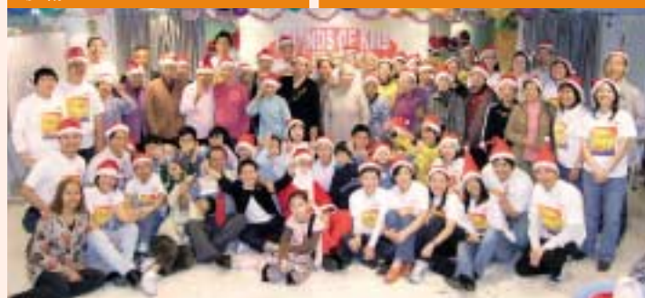
節目結束前，大家與聖誕老人來個大合照。

「長幼共融」系列在2007年共安排了三次活動。在活動中，長者及小朋友須經過商量及互相合作，才能完成指定的要求，透過在過程中互相討論、合作及支持，大家充分發揮互助互諒及長幼共融的精神，更培養小朋友敬老護老的品德修養。☺