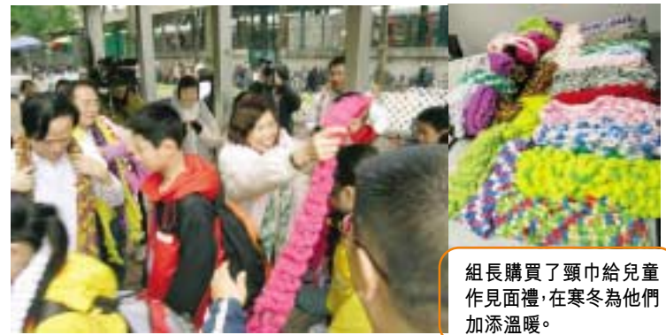
組長購買了頸巾給兒童作見面禮，在寒冬為他們加添溫暖。

儘管今年的農曆新年在持續的寒冷天氣警告下度過，但對「九巴之友」的組長來說，這是一個見證「人間有情」的春節假期，因為「九巴之友」應基督教正生會之邀請，參與了一個名為「我有一個家在香港」的活動，把愛心和溫暖送給國內一群無助的小朋友。