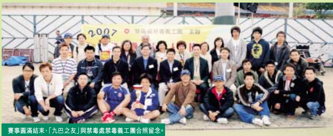
賽事圓滿結束，「九巴之友」與禁毒處禁毒義工團合照留念。

「九巴之友」自2002年成為禁毒處禁毒義工團的企業義工以來，一直支持禁毒義工團舉辦的活動，協助宣揚禁毒訊息。禁毒義工團於去年聖誕節假跑馬地人造草小型足球場舉辦第二屆「無毒聖誕盃」七人足球賽，以「足球」這運動倡導青少年建立健康生活模式，遠離毒品。