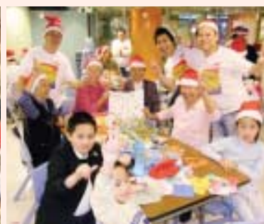
看看大家合力創作的聖誕卡，色彩繽紛，設計獨特。