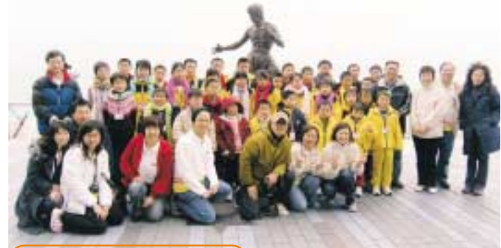
來到「星光大道」，小朋友對地上的掌印很好奇，但對「李小龍」卻毫不陌生。

今年「我有一個家在香港」得到中國扶貧基金會的協助，安排了31名兒童來港度歲，當中20名是來自福建的孤兒，11名是來自河南患了「愛滋病」的兒童或因「愛滋病」而失去雙親的孤兒。基督教正生會安排了這些兒童在年廿九至年初五與26個香港家庭一起生活，而「九巴之友」則負責首尾兩日的巴士接載，還帶他們「遊車河」，到星光大道、青馬橋、香港國際機場、迪士尼樂園等景點瀏覽。對出生以來都沒有乘搭過巴士，也沒看過大海的小朋友來說，這次是一個難忘的經歷。而於2月10日（年初四）「九巴之友」接待他們與香港家庭的成員一起到荔枝角廠參觀和到九巴總部玩遊戲，度過了一個歡欣的下午。