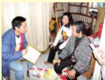
「九巴之友」與長者閒話家常，在寒冬裡為長者帶來一點溫暖。