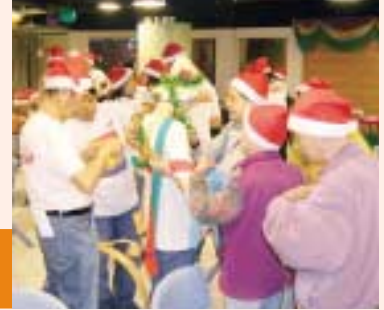
大家齊來為「聖誕樹」掛上精心泡製的裝飾。