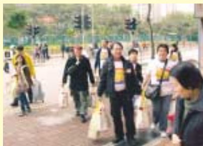
各人挽著禮物包，帶著愉快的心情前往探望長者。