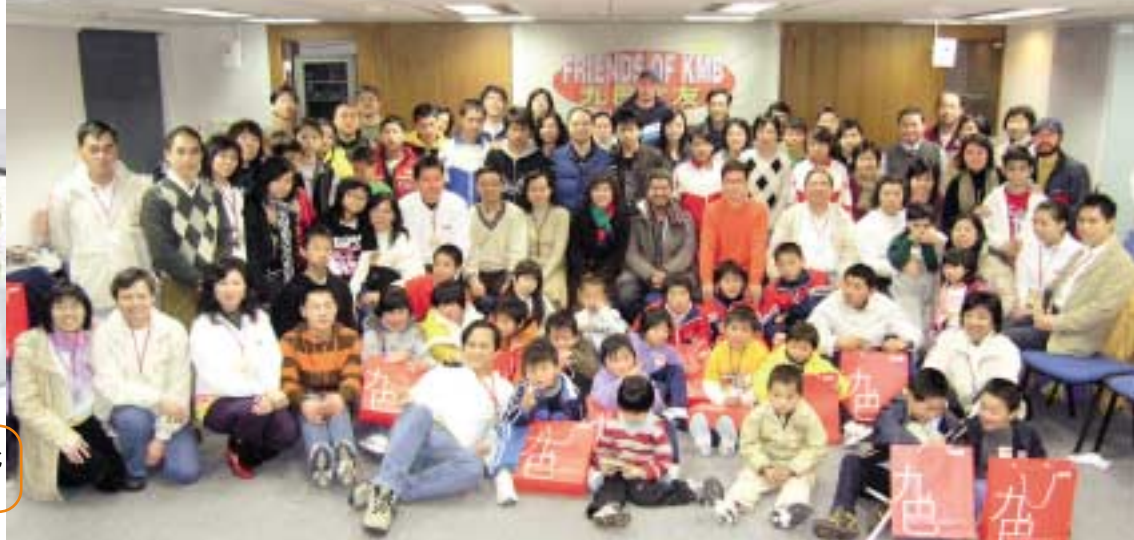
小朋友與「九巴之友」玩得如此開心，一定要拍張大合照留念。