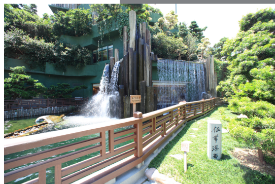
志蓮淨苑 Chi Lin Nunnery