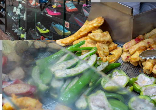
Street Food 街頭小食