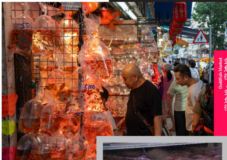
Goldfish Market 金魚街 / 金鱼街