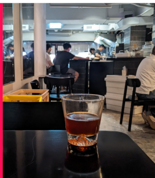
鴨寮街 (電子街) 鴨寮街 (电子街) Ap Liu Street (Electronics Street)

文青咖啡店 Cafés with rich artistic atmosphere