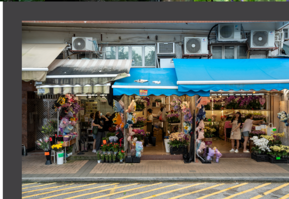
Flower Market 花墟 花墟

太子花墟雲集了超過一百間花店，色彩斑斕、不同品種的花應有盡有，除了鮮花盆栽，這裏也有各款園藝用品，適合喜歡園藝花藝的朋友。