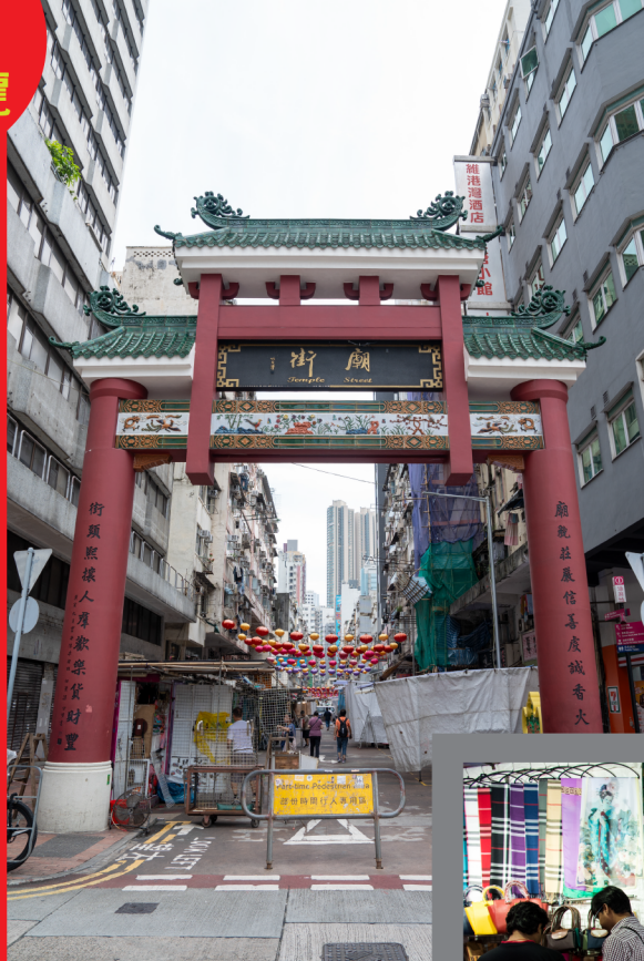
廟街 Temple Street