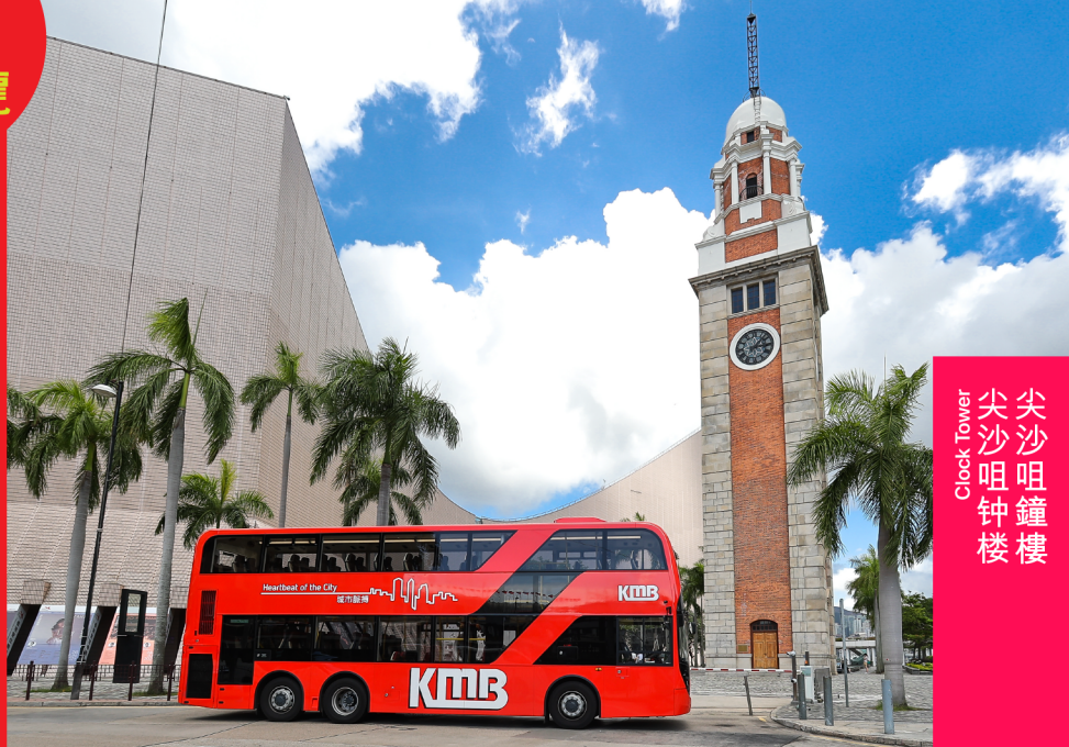
尖沙咀鐘樓 Clock Tower