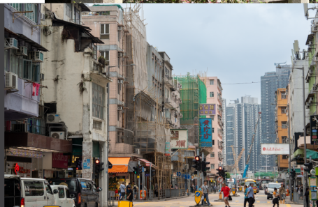
九龍寨城公園 Kowloon Walled City Park