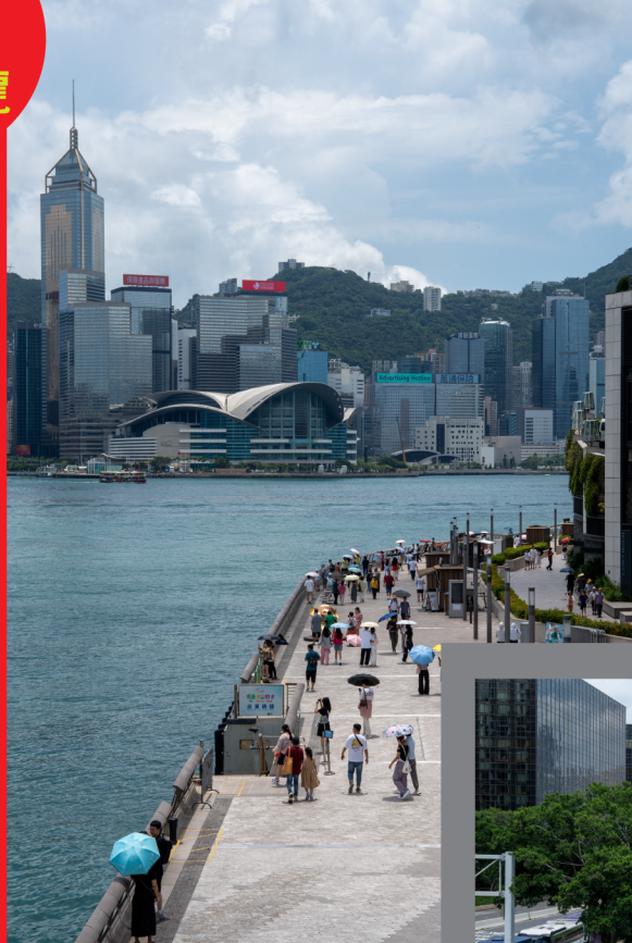
尖沙咀海濱花園 Tsim Sha Tsui Promenade