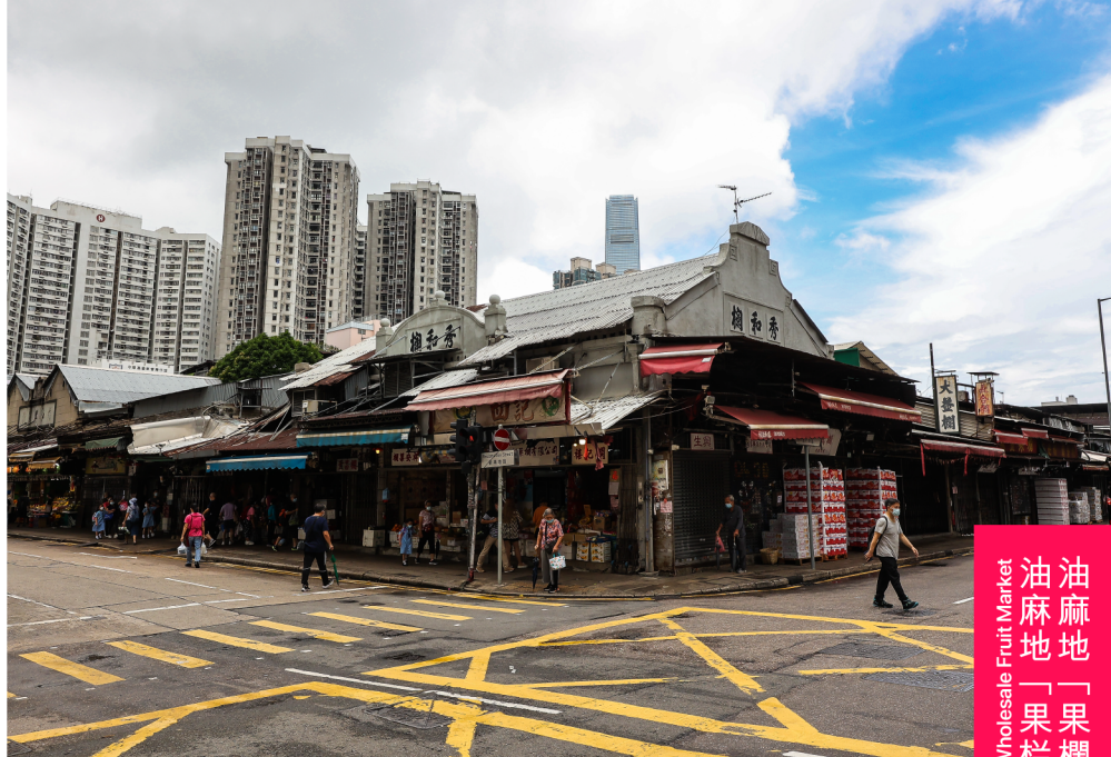
油麻地「果欄」 Yau Ma Tei Wholesale Fruit Market