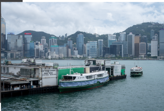
尖沙咀碼頭 Star Ferry Pier

在尖沙咀碼頭這裏，您可以換乘渡海小輪，暢遊維多利亞港；或者前往擁有百年歷史的尖沙咀鐘樓打卡；太空館、藝術館和文化中心，就適合一眾文藝青年；喜歡購物的，就不可以錯過總站旁的大型商場了。