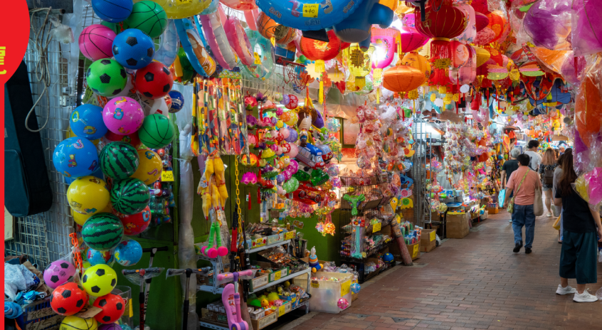
Fuk Wing Street (Toys Street) 福榮街 (玩具街)

文青咖啡店 Cafés with rich artistic atmosphere