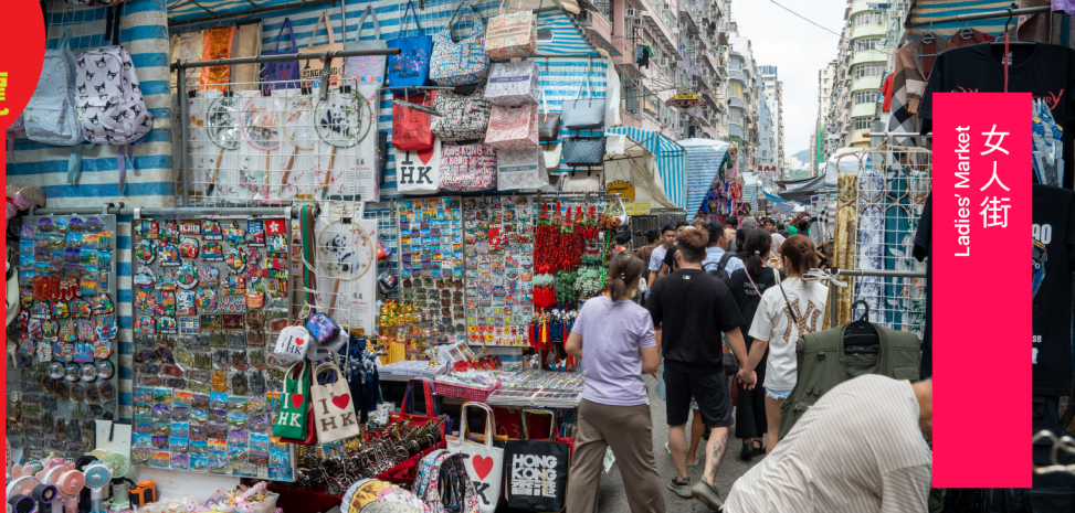
Ladies' Market 女人街