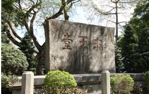
宋王臺花園 Sung Wong Toi Garden