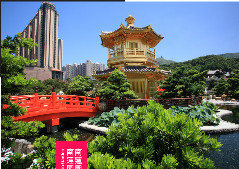
Nan Lian Garden 南蓮園池