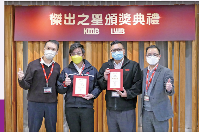
▶得獎者來自不同部門，除了有前線車務同事，亦包括後勤支援員工。