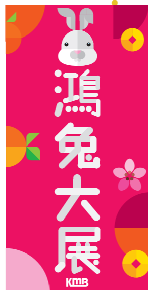
▲九巴向市民免費派發癸卯兔年揮春，祝各位市民新一年「吐氣揚眉」、「鴻兔大展」。

除了生肖巴士，市民亦可在全港七十四個大型巴士總站及客務站免費領取兔年賀年揮春，祝願市民在新一年「兔氣揚眉」、「鴻兔大展」。