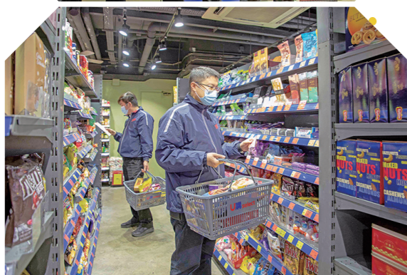
▲Store1933已重新投入服務，開門七件事柴米油鹽醬醋茶一應俱全，全方位照顧同事所需。