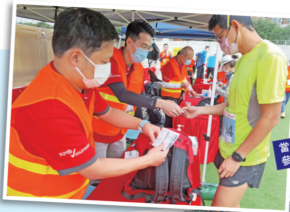
當日九巴之友協助參加者寄存行李。