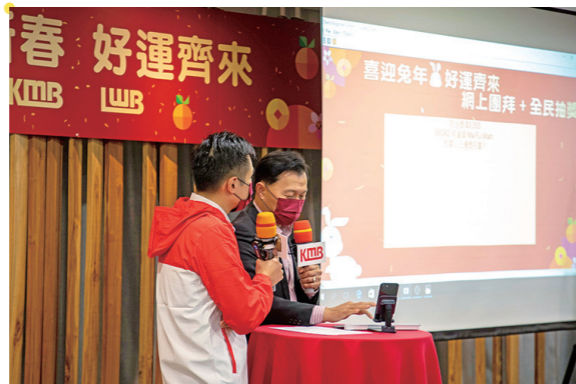
▲管理層與部門主管一同抽出多份獎品，氣氛緊張！