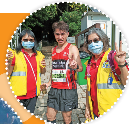
九巴跑步會成員亦有參與，於補給站與義工留影。