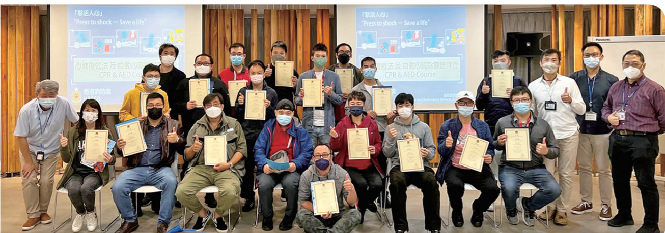
出席課程的參加者獲授予出席證書。