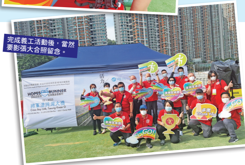
完成義工活動後，當然要影張大合照留念。

九巴之友經常為籌款及大型活動提供支援，與社福機構建立合作夥伴關係。十多名義工在一月十五日早上，參與基督教靈實協會舉辦的「靈實生命跑及慈善行」，協助場地布置及為參加者提供行李寄存服務。是次活動於將軍澳跨灣大橋舉行，是大橋通車後首個大型慈善跑及步行籌款活動，為靈實的非政府資助服務籌募經費。