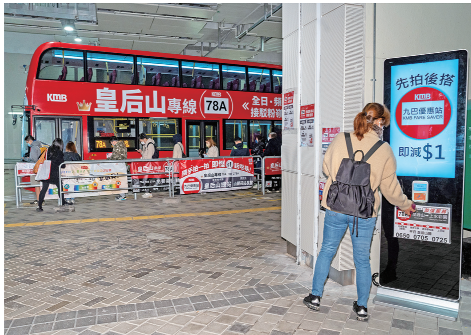
▼皇后山巴士總站的「九巴優惠站」設於78A線站位附近，方便乘客賺取優惠。