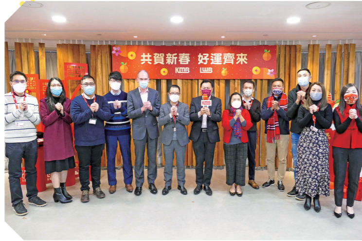
▼九巴一眾管理層出席新春團拜，祝願各同事及家人心想事成，身體健康、路路暢通、出入平安。

抽獎之外，當日一眾九巴管理層亦透過直播與各位員工拜年，祝願新一年大家心想事成、身體平安，亦祝公司鴻「兔」大展。想重溫當日精彩片段，或查閱得獎名單，可以瀏覽Facebook「九巴員工專頁」。各位管理層亦會由年初十至十三走訪多個主要巴士總站，向員工拜年，祝願各位同事開工大吉。