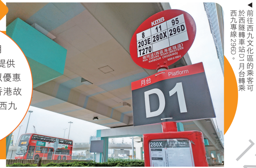
前往西九文化區的乘客可於西隧轉車站D1月台轉乘西九專線296D。