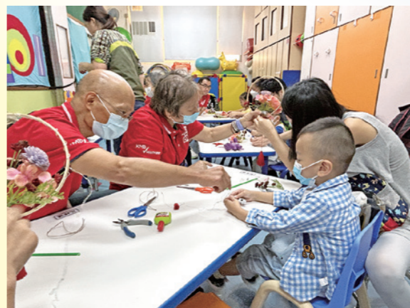
▶義工們與學童和家長齊心合力完成獨一無二的燈籠。