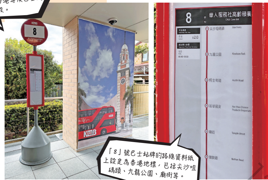
「8」號巴士站牌的路線資料紙上設定為香港地標，包括尖沙咀碼頭、九龍公園、廟街等。