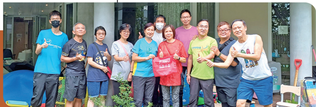
▶大功告成，義工們合照留念。