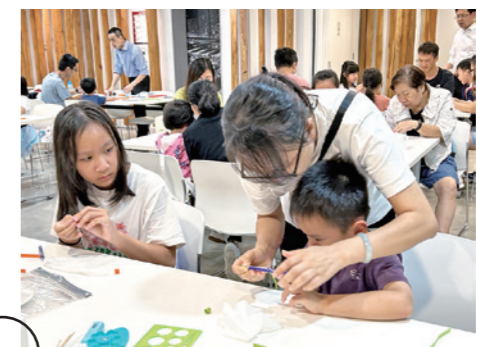
▲九巴員工與子女一同製作卷紙畫後，合照留念。