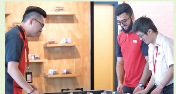
▲九巴主動聘請非華裔人士，致力建設一個共融和包容的工作環境。

九巴及龍運致力推動社會多元及共融文化，簽署平等機會委員會的《種族多元共融僱主約章》，承諾推動種族多元工作間，讓所有員工在同一工作環境下獲得平等機會。九巴去年八月已在九龍清真寺舉辦開放日暨就業講座，向非華裔人士介紹九巴服務及即場招聘車長等職位，是全港首間專營巴士公司在清真寺內舉辦招聘活動。九巴服務香港九十年，一直秉持用人唯才的原則，樂意並積極招聘非華裔人士，讓他們盡展所長，同時建設一個共融和包容的工作環境。