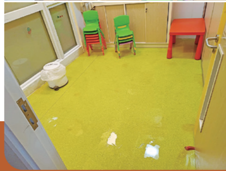
▲刷、刷、刷，還回活動室原貌了！