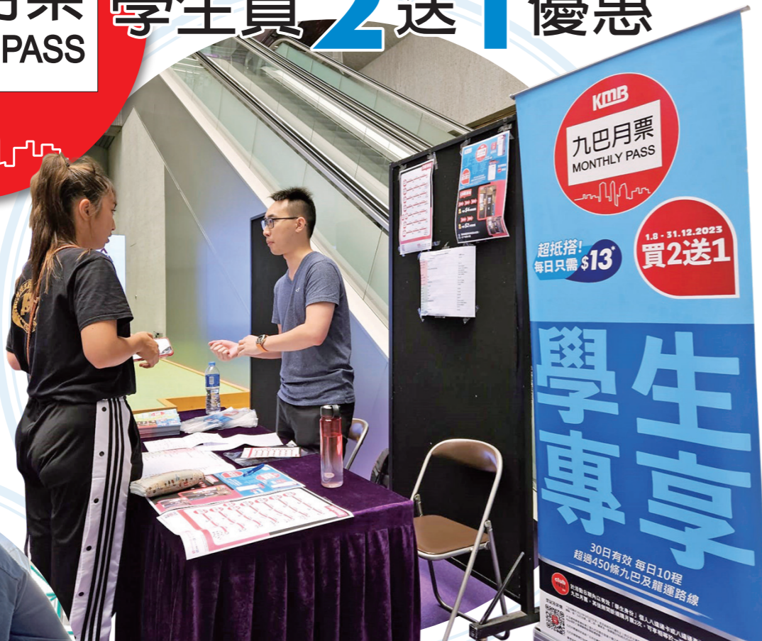
▲九巴到不同大專院校，向學生介紹九巴月票學生專享優惠。

九巴月票學生買二送一優惠計劃強勢回歸！為了令大專學生更加掌握優惠詳情和鄰近的九巴網絡，九巴早前趁大專生開學，親身走進校園為學生登記優惠，並派發特別設計的單張，介紹巴士網絡及「大專優惠站」位置。