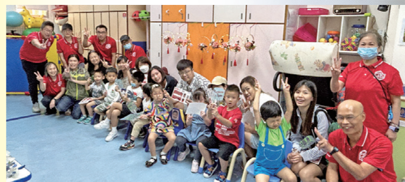
▲大功告成！當然要齊齊影張大合照留念。