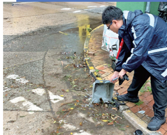
▲颱風及暴雨過後多處道路有塌樹及雜物，九巴前線車務督察加緊巡邏及協助清理，確保路面狀況可以安全行駛。

非常感謝尾班74X觀塘往大埔方向的司機哥哥，平安送我地回來，今晚真無所無，凌晨近兩點仍在彩虹塞緊，出了大老山中途改道，快送到廣福軒時，離邊已見到又塞滿，再改道後最後全車人齊在大埔中心塞車。祝福同車的大埔友今晚個個平安！再次想同司機講：辛苦晒！