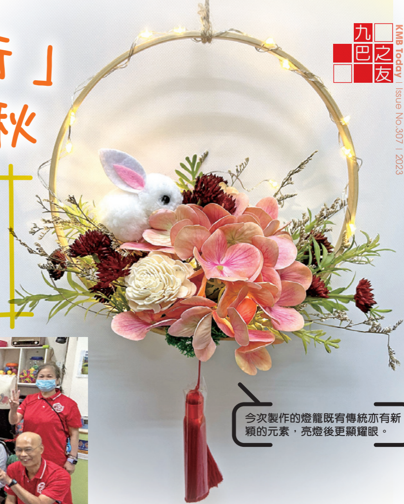
今次製作的燈籠既有傳統亦有新穎的元素，亮燈後更顯耀眼。

中秋節的傳統，除了食月餅之外，又怎少得燈籠呢！九巴之友參與香港耀能協會隆亨幼兒中心舉辦的「樂天心同行」活動，與一班有特殊教育需要(SEN)的學童和他們的家人親手製作精美中秋節燈籠，一同團圓慶祝佳節。