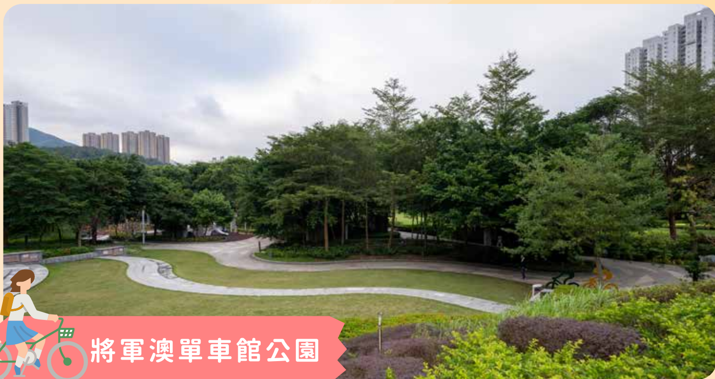
將軍澳單車館公園

秋冬天氣清涼，最適合約同三五知己在青青草原上野餐慢活一下。香港雖然建築物林立，但其實很多野餐勝地隱藏在鬧市之中，有環境清幽的，也有海景相伴的，在草地上與朋友席地而坐，談天說地，同時享受大自然美景，將所有煩惱拋諸腦後，輕鬆愜意度過一個下午，豈不美哉？