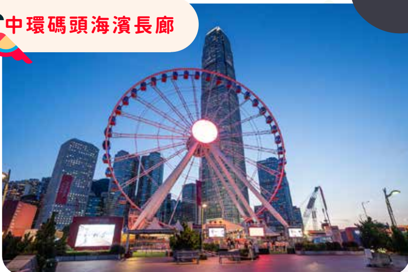
中環碼頭海濱長廊

將軍澳海濱公園沿將軍澳和調景嶺海岸而建，在海邊散步肚餓，沿路亦有不少寵物友善食肆和商場，有些餐廳更提供寵物餐單，服務周到。連接公園的將軍澳南海濱長廊可步行至日出康城，並到訪全港最大的寵物公園——環保大道寵物公園。